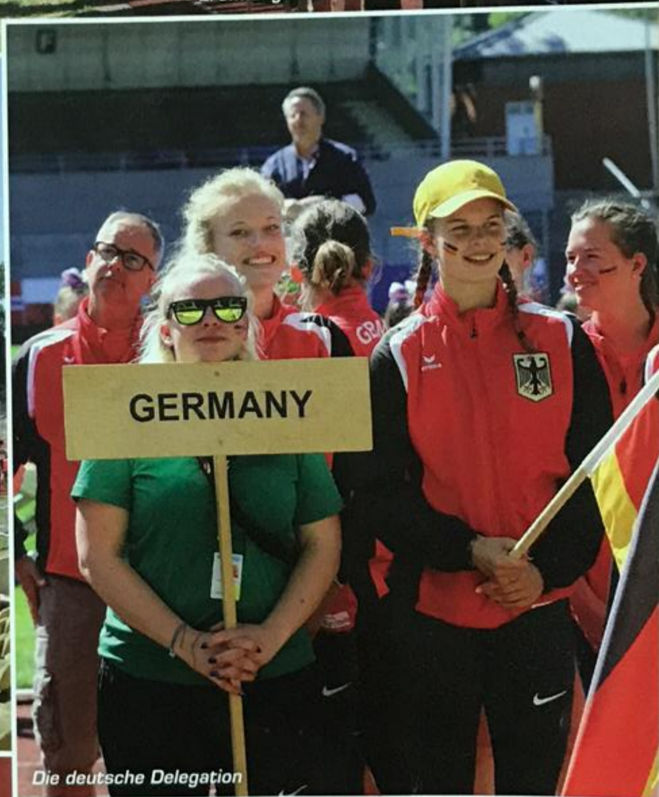
Die deutsche Delegation