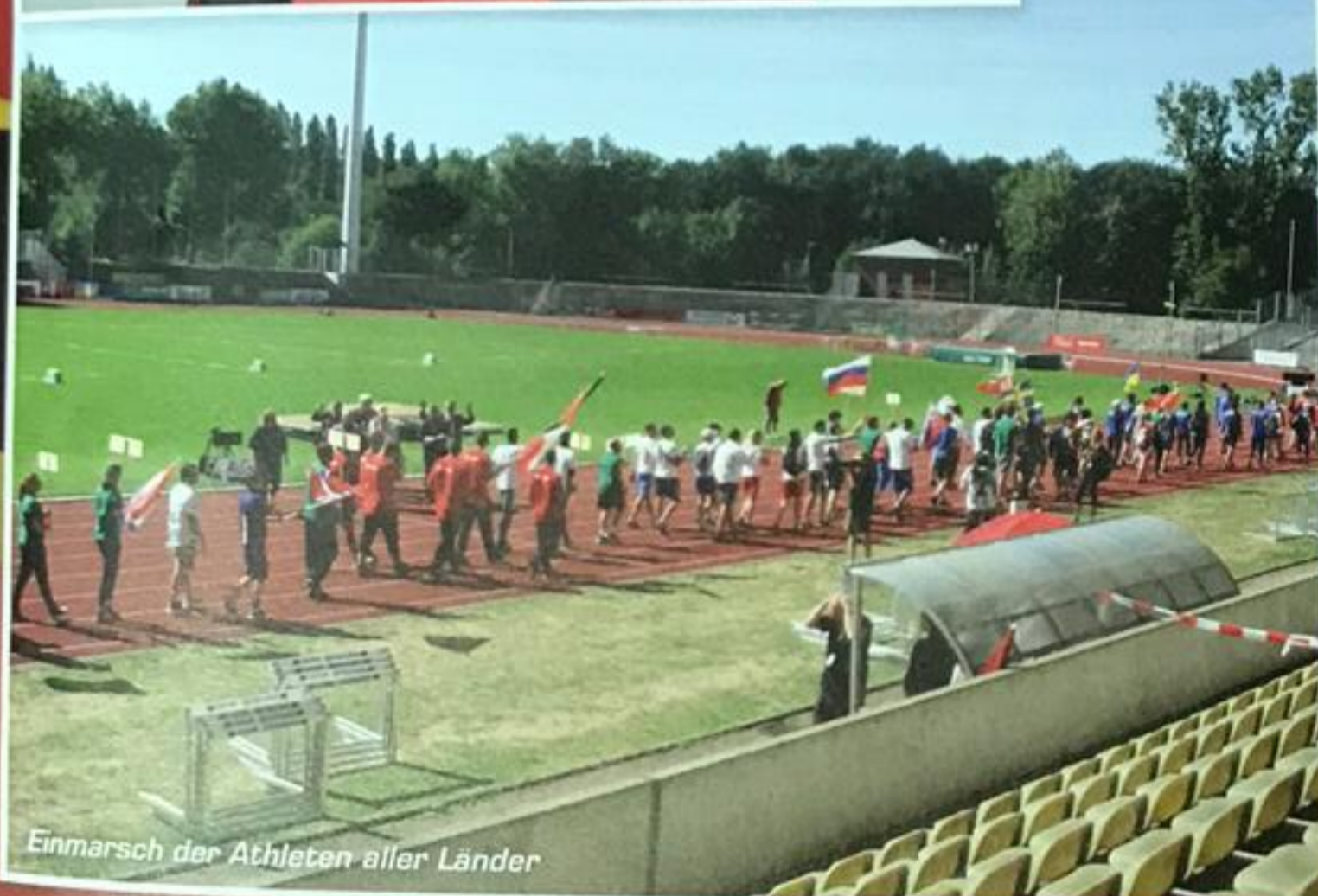
Einmarsch der Athleten aller Länder